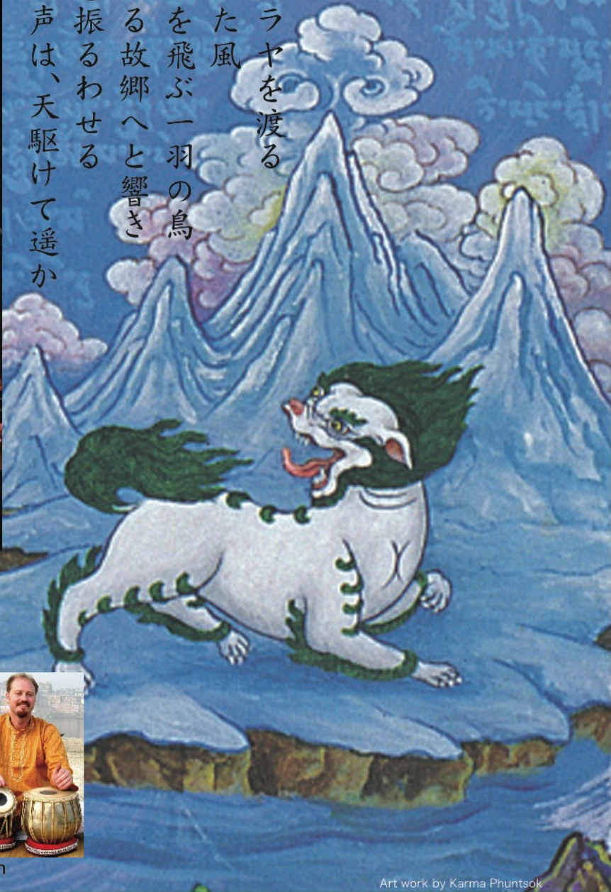
Art work by Karma Phuntsok

ヒマラヤを渡る 乾いた風 高みを飛ぶ一羽の鳥 母なる故郷へと響き 魂を振るわせる この声は、天駆けて遙か